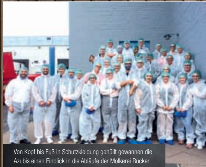
Von Kopf bis Fuß in Schutzkleidung gehüllt gewannen die Azubis einen Einblick in die Abläufe der Molkerei Rücker