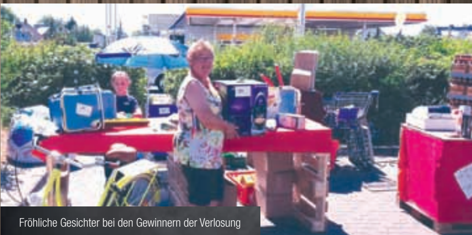
Fröhliche Gesichter bei den Gewinnern der Verlosung

Daneben haben auch andere Organisationen ihren Beitrag geleistet, damit der Saisonauftakt zum Erfolg wurde. „Die Feuerwehr hat die Bierzeltgarnitur zur Verfügung gestellt, und zwei Mädchen vom THW haben beim Ausschank der Getränke geholfen“, berichtet Ehlert. Sie ist dankbar für den Zusammenhalt der Menschen in Born, der so etwas möglich macht. „Alles hat gut geklappt, weil alle mitgezogen haben“, weiß sie. Entsprechend zuversichtlich kündigt sie an, dass sie das Ganze im nächsten Jahr wiederholen will. Nur eines wird sie dann anders machen. „Das nächste Mal denken wir an Schirme gegen die Sonne – oder gegen den Regen – je nachdem, wie das Wetter im nächsten Jahr wird!“