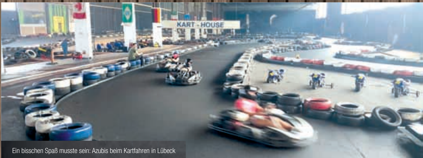
Ein bisschen Spaß musste sein: Azubis beim Kartfahren in Lübeck