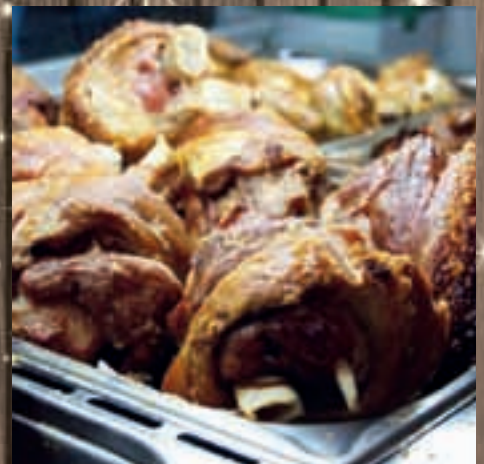
Traditionelle Haxn waren eine gern gewählte Grundlage