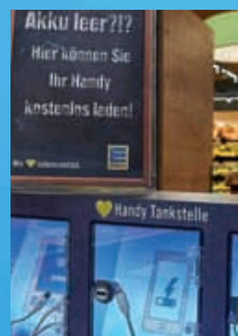
Service erhalten Kunden nicht allein durch die Mitarbeiter. Überall im Markt zeigen sich tolle Dienstleistungen, die das Einkaufen noch angenehmer machen.