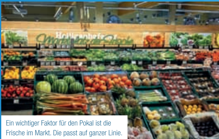
Ein wichtiger Faktor für den Pokal ist die Frische im Markt. Die passt auf ganzer Linie.

Übrigens: Durch die Bäderregelung hat der Markt auch sonntags von 11 Uhr bis 17 Uhr geöffnet – was nicht nur die Wochenendbesucher der Küstenstadt freuen wird.