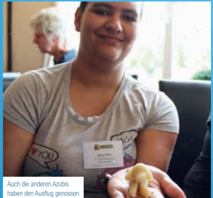
Auch die anderen Azubis haben den Ausflug genossen