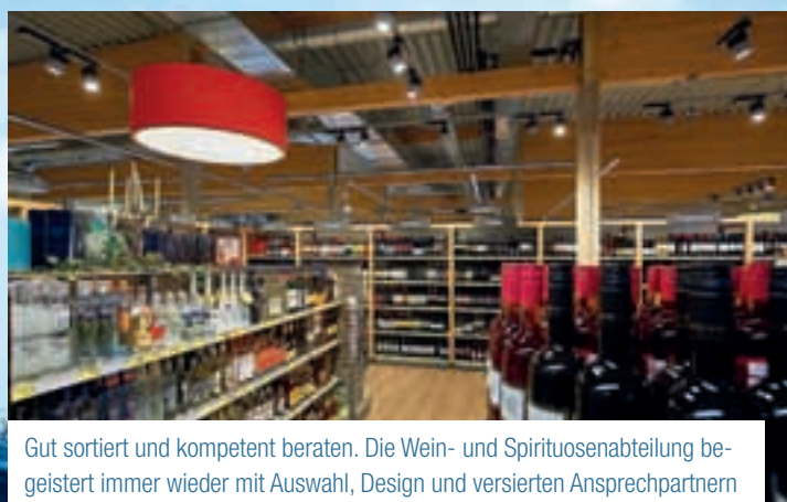
Gut sortiert und kompetent beraten. Die Wein- und Spirituosenabteilung begeistert immer wieder mit Auswahl, Design und versierten Ansprechpartnern