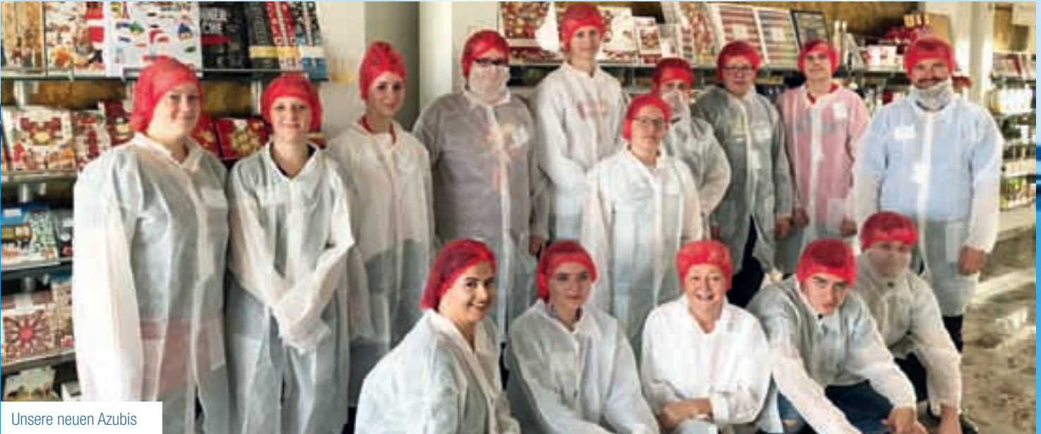
Unsere neuen Azubis

Es ist Tradition, dass EDEKA Jens seine neuen Auszubildenden nicht ins kalte Wasser wirft, sondern erst einmal eine gemeinsame spaßige – dennoch lehrreiche – Unternehmung anbietet: den Azubitag. Nachdem sich die 13(!) frischen Nachwuchskräfte ein paar Tage in ihre Märkten eingearbeitet und aklimatisiert hatten sowie Mitarbeiter und Ausbildungspaten kennenlernen konnten, stand der Besuch der Firma Niederegger in Lübeck an.