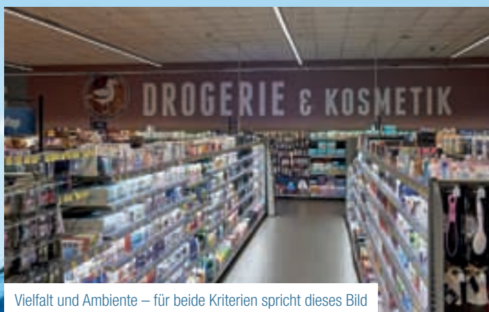
Vielfalt und Ambiente – für beide Kriterien spricht dieses Bild