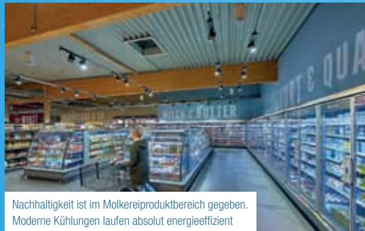
Nachhaltigkeit ist im Molkereiproduktbereich gegeben. Moderne Kühlungen laufen absolut energieeffizient