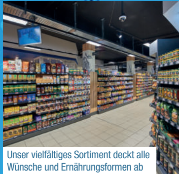
Unser vielfältiges Sortiment deckt alle Wünsche und Ernährungsformen ab

Wir wählen unsere Sortimente sorgfältig aus. Zum einen kommen die Klassiker, also Produkte, die immer beliebt sind, in die Regale und sie werden mit Trends ergänzt. Wir halten uns stets auf dem Laufenden, suchen neue Partner – vornehmlich in der Region. Außerdem haben auch Kunden Einfluss auf die Artikelgestaltung, denn auch aus den speziellen Nachfragen gehen viele Produkte hervor, die dann unsere Vielfalt bereichern.