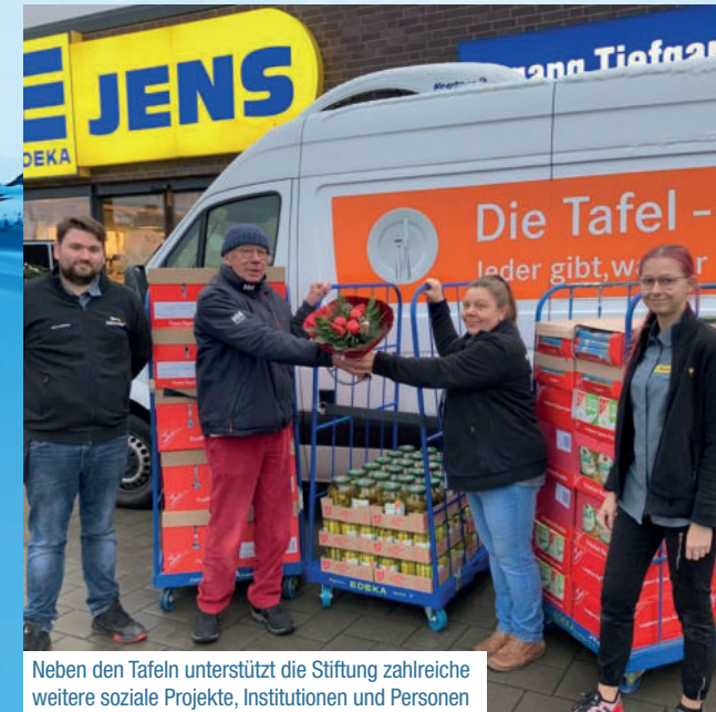
Neben den Tafeln unterstützt die Stiftung zahlreiche weitere soziale Projekte, Institutionen und Personen