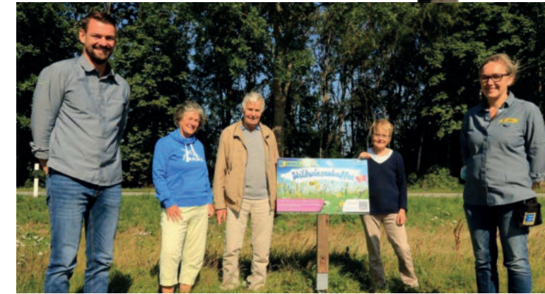
Der Anfrage des NABU, auf der Wiese vor dem Markt in Heiligenhafen eine Wildblütenwiese entstehen zu lassen, haben wir sofort zugestimmt, mit unseren Azubis Saaten ausgestreut und das Mähen eingestellt.