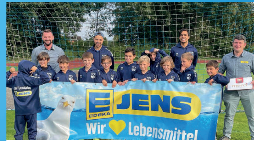
Dank der Unterstützung durch die „Reimer & Magdalene Jens Stiftung“ konnten sich die Fußballer der E1-Jugend des TSV Lensahn über neue Trainingsanzüge und die Spieler der D-Jugend des SV Neukirchen über neue Trikots freuen. Die Kinder laufen nun stolz mit neuem Dress auf.