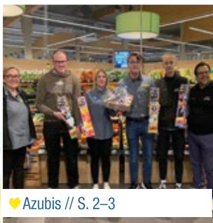
♥ Azubis // S. 2–3