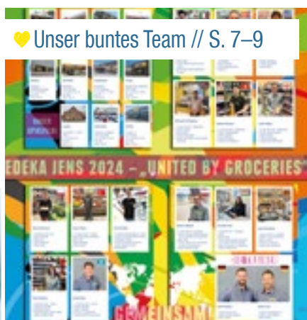
♥ Unser buntes Team // S. 7–9