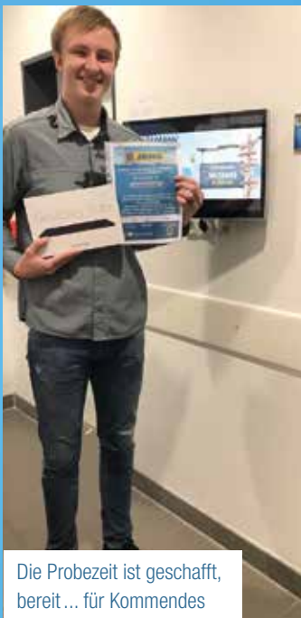
Die Probezeit ist geschafft, bereit ... für Kommandes