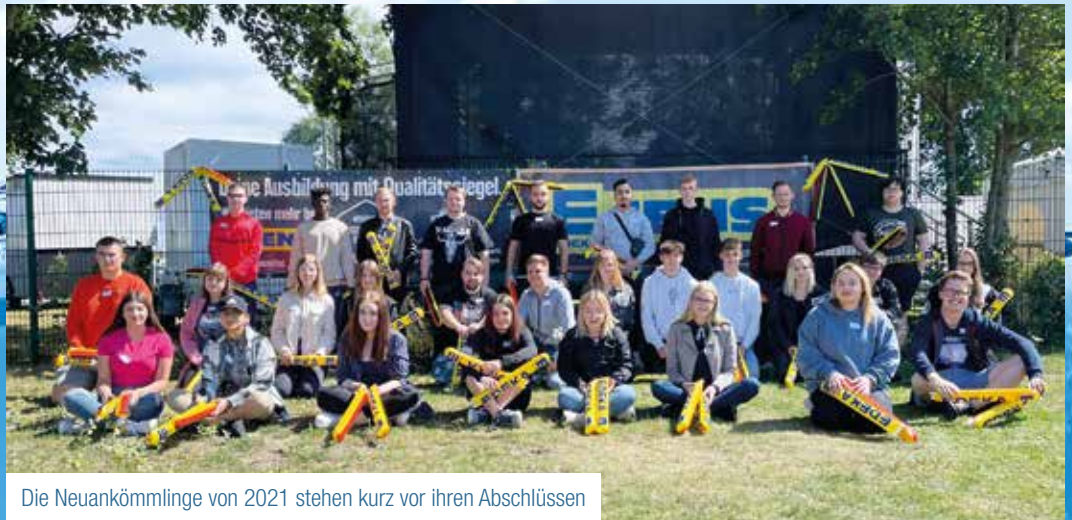
Die Neukömmlinge von 2021 stehen kurz vor ihren Abschlüssen

Und wieder ist das Jens-Team stolz darauf, die nächste Generation an Kaufleuten auf ihren Weg zu bringen. 19 Auszubildende aus den zweiten und dritten Lehrjahren haben sich erfolgreich für die Abschlussprüfungen in diesem Jahr angemeldet. Dabei ist das Feld breit gefächert – von Verkäufern über Kaufleute im Einzelhandel bis hin zu Fleischern.