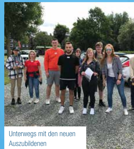
Unterwegs mit den neuen Auszubildenen