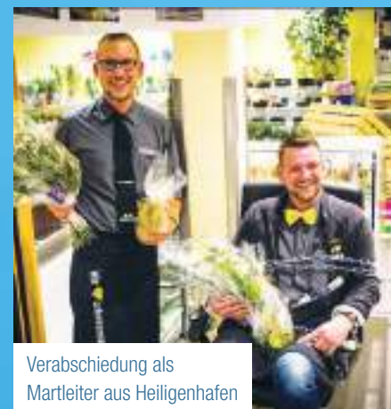
Verabschiedung als Marktleiter aus Heiligenhafen