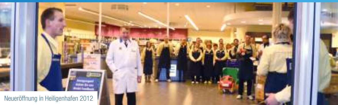
Neueröffnung in Heiligenhafen 2012