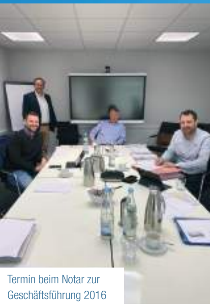
Termin beim Notar zur Geschäftsführung 2016